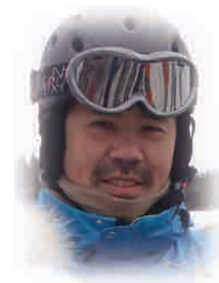
日本アルクス自然学校 校長

おうちの人と離れて、見知らぬ場所で見知らぬ人と生活するので自分のことは自分でしないといけません。勇気とチャレンジの心を持っていないとおもしろくないし、友達もできないかもしれません。キャンプ・合宿なので、おうちや日常生活では当たり前なのが当たり前ではなく不便だし、集団行動なので“わがまま”や個人主義は通用しません。